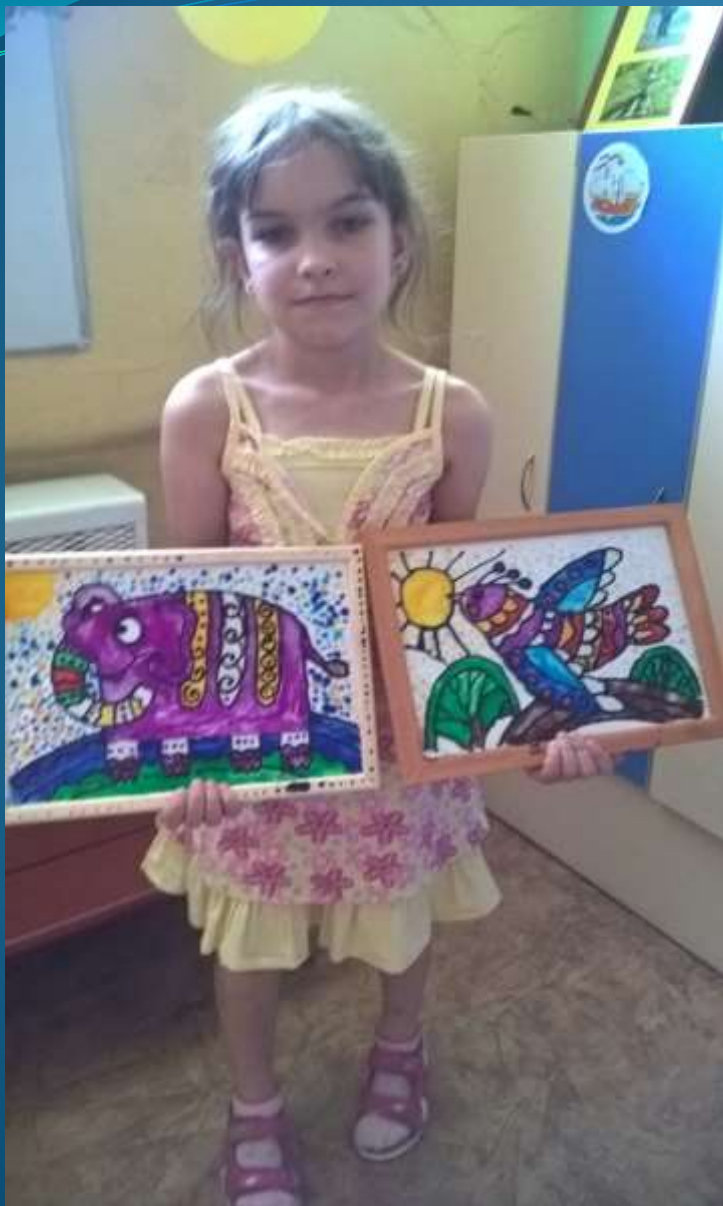
Витражная роспись Автор: Гаврилова Юлия Владимировна (мама Вириinei)